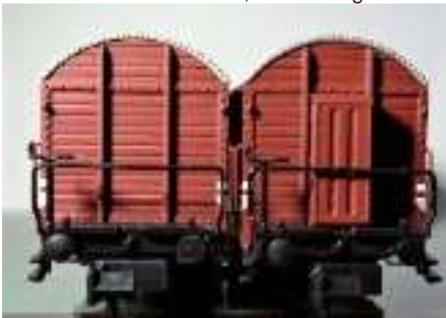
Bild 9 Bremserstände

Geradezu sensationell ist die Maßhaltigkeit des Modells: Der 13 m lange Güterwagen hat eine Länge von 81,3 mm über LüP (wobei die Puffer aus Metall sind); auch beim Achsstand (42,5 mm), Wagenkastenlänge (70,4 mm) und Höhe (25,4 mm) gibt es nichts zu meckern. Nur die Bremserbühne ist ein paar Zehntelmillimeter zu breit ausgefallen. Die 12 Bretterlagen sind stimmig, nur die Fugen der Bretter hätten etwas