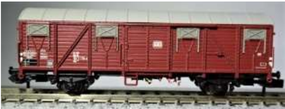
Bild 6 Wagen Ep 4 DB ohne Bremserstand