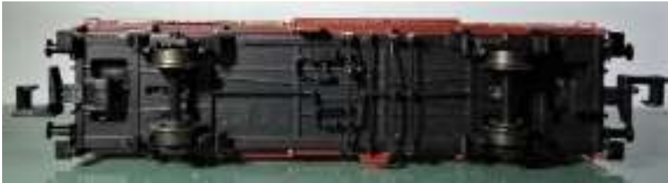
Bild 8 Wagen von unten

Neue Wege beschritt Liliput bei der Wagenkonstruktion: Im Gegensatz zu den meisten anderen gedeckten Güterwagen hat er ein paar Besonderheiten: Der Wagen ist verschraubt und hat zusätzliche Abdeckplatten für die Kupplung, sodass beim Öffnen des Wagens die Rückholfeder der Kupplung nicht „flöten gehen“ kann. Überdies ist das Dach in den Wagenkasten geclipst, daher kann man- wenn es gefällt, von Wagen anderer Epochen das Dach tauschen, so z.B. das silberfarbene Dach der Epoche 3 gegen ein graues Dach der Epoche IV.