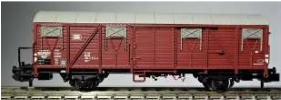
Bild 5 Wagen Ep 4 DB mit Bremserstand