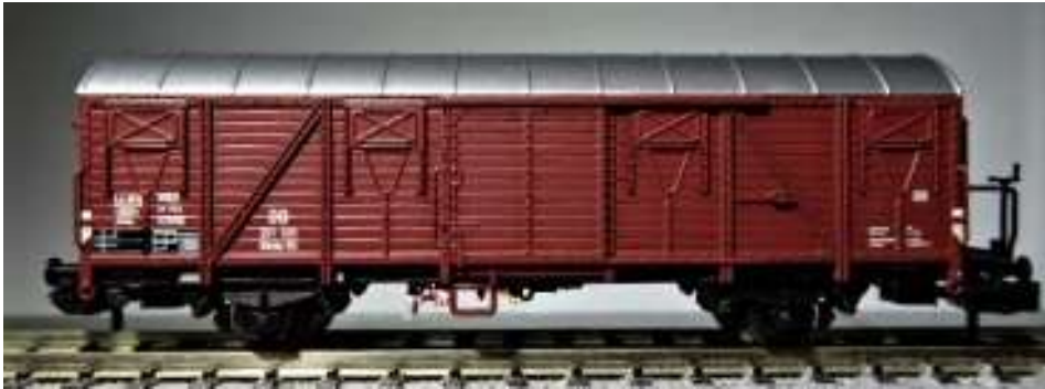
Bild 3 Wagen Ep 3 DB mit Bremserhaus

In dem nachstehenden Beitrag geht es um die Güterwagen von Liliput, die nur Bretterwände hatten.