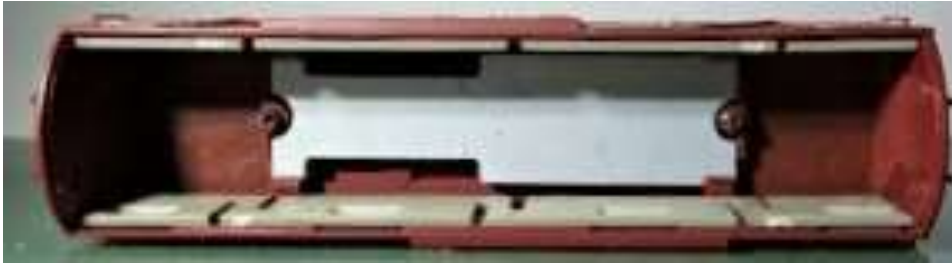
Bild 7 Wagen ohne Dach