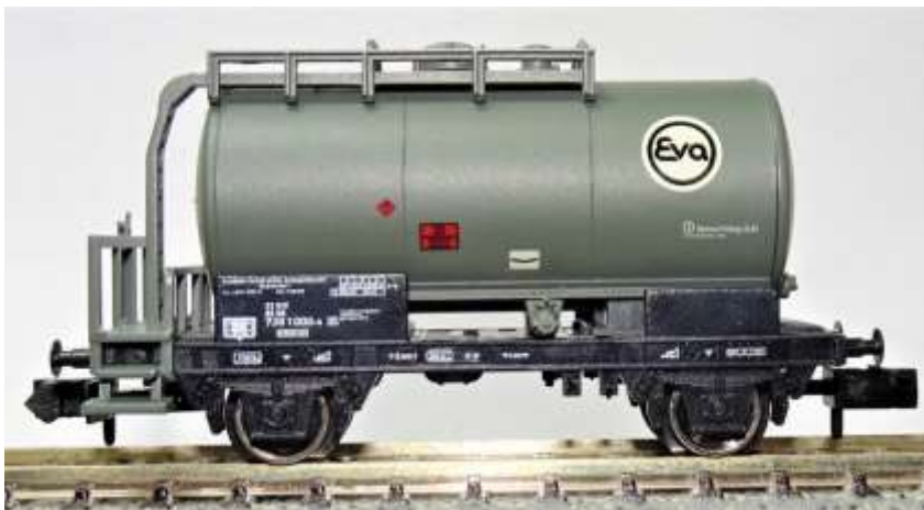
Bild 4: Minitrix Kesselwagen 30 m 3 (ohne Vorbild) - baugleich IVG Kesselwagen