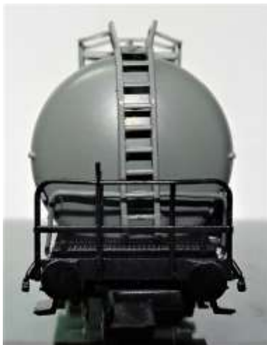
Bild 9: MU Kesselwagen von Vorn

Zur Neuheit selbst: Man kann sich einfach gar nicht satt sehen an den vielen Details des Wagens. Immer wieder fallen neue Details auf und deren gute Umsetzung im Modell. Hier ein paar Detailfotos des Wagens: