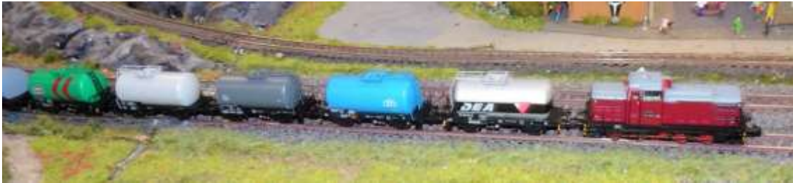
Bild 13. Kesselwagen im Einsatz auf Modellbahn

Der Kesselwagen ist universell einsetzbar: Als Ganzzug, so etwa mit 15 bis 20 Kesselwagen, oder aber auch als Einzelwagen im Nahgüterzug bzw. in der Übergabe. Vorherrschend sollten dabei wie beim Vorbild die grau-schwarzen Kesselwagen sein; ein bunter kann schon mal darunter sein. Kurz: ein Muss für jeden Epoche III bis V- Fahrer, am besten gleich in mehrfacher Ausführung. Auch hierbei hat MU vorgesorgt: Alle Kesselwagen werden mit 3 verschiedenen Wagennummern angeboten.