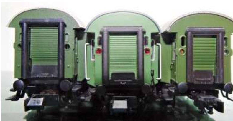
Bild 21: Umbauwagen von vorne -Flm (li)- Minitrix (Mitte) Roco (re)

In Bild 19 sieht man die „Hochbeinigkeit“ des Fleischmann-Wagens. Mischt man Wagen von Minitrix und Fleischmann in einem Zug, fällt die unterschiedliche Dachhöhe der Wagen auf. Besser wäre es, in einem Zug auf die Fleischmann-Wagen zu verzichten. Dagegen harmonisieren die Minitrix- und Roco-Wagen ausgezeichnet, wie aus Bild 20 ersichtlich. Nur der Grünton ist anders, was aber mit den Farbvorschriften der DB zum Zeitpunkt des Entstehens (bzw. Revision) zu erklären ist. Fazit hier- Roco- und Minitrix-Wagen kann man kombinieren, wenn die Beleuchtung unberücksichtigt wird.