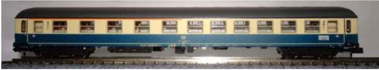
Bild 4: Neuer Am225 o/b von Fleischmann Gangseite