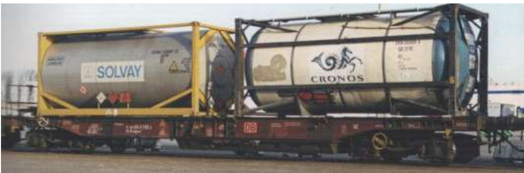
Bild 2: Vorbildfoto Sdkams 707

Hier folgen ein Vorbildfoto und eine Maßskizze des Wagens.