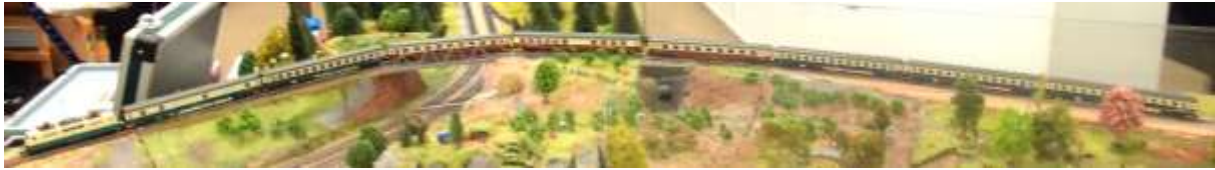
Bild 11: FD 1922 „Berchtesgadener Land“ im Modell -Lok Fleischmann

FD 1922 mit dem Laufweg Salzburg- Dortmund, gezogen von einer BR 111 von Fleischmann.